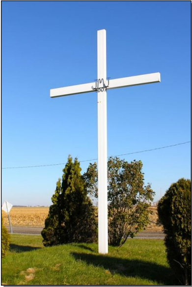
Croix située sur la 137 à l'intersection du rang des Moulins . Croix de métal peinte en blanc, axe ornementé, extrémités à motif aigu. Axe : JMJ (Jésus Marie Joseph) 2002, en fer forgé noir. Année de construction : 2002.