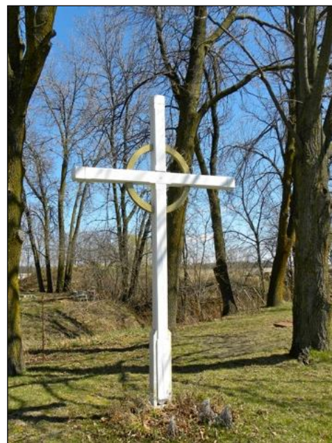
Croix située au 268 chemin de Patriotes.

Croix de bois peinte en blanc, chanfreinée.