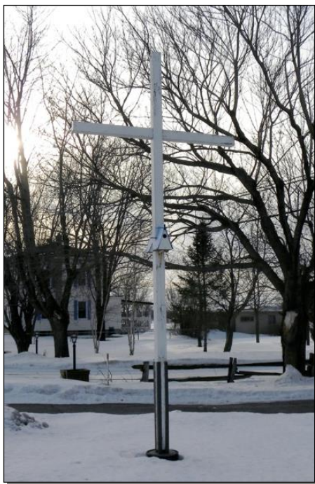
Croix située au 991 chemin des Patriotes.

La paroisse de Saint-Denis a compté au moins une dizaine de croix de chemin. Au village, une croix fut élevée en 1837 sur la terre de madame St-Germain. On y retrouve aujourd'hui un cairn rappelant le lieu de la bataille du 23 novembre 1837. Il y eut également une croix de tempérance et de mission érigée devant l'église, en 1942. Tombée vers 1910, elle n'a pas été renouvelée depuis. Aujourd'hui, Saint-Denis ne compte plus que 5 croix de chemin que nous retrouvons aux adresses suivantes :