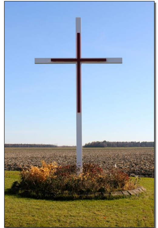
Croix située au 615 route 137 . Croix en métal de type simple, extrémités à motif aigu. Une croix de taille plus petite, en métal et peinte en noir est placée au centre de la croix principale.