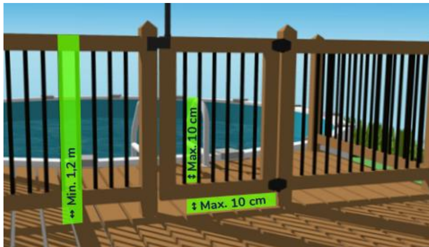
Figure 2 : Exemple d'une enceinte conforme.

Système passif* : dispositif par lequel l'accès se referme et se verrouille sans intervention manuelle et ne nécessite aucune action volontaire.