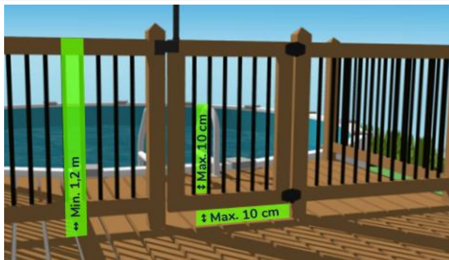
Figure 2 : Exemple d'une enceinte conforme.

Système passif* : dispositif par lequel l'accès se referme et se verrouille sans intervention manuelle et ne nécessite aucune action volontaire.